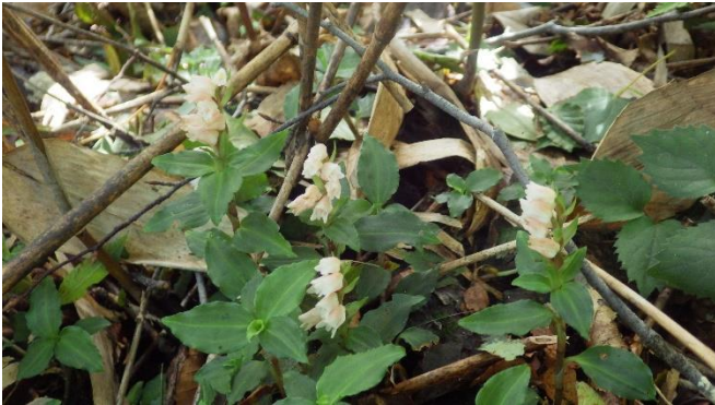
クマザサの藪の中にも