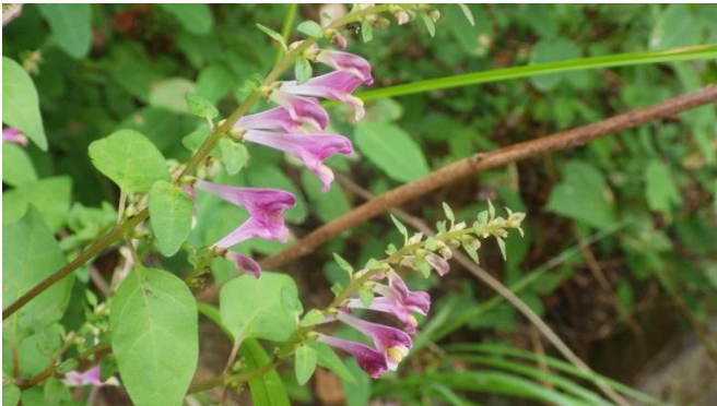
ミヤジマママコナ