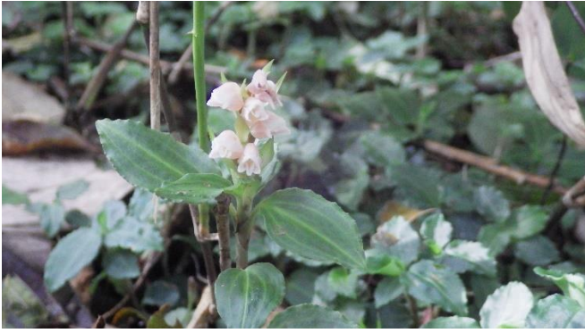
アケボノシュスラン