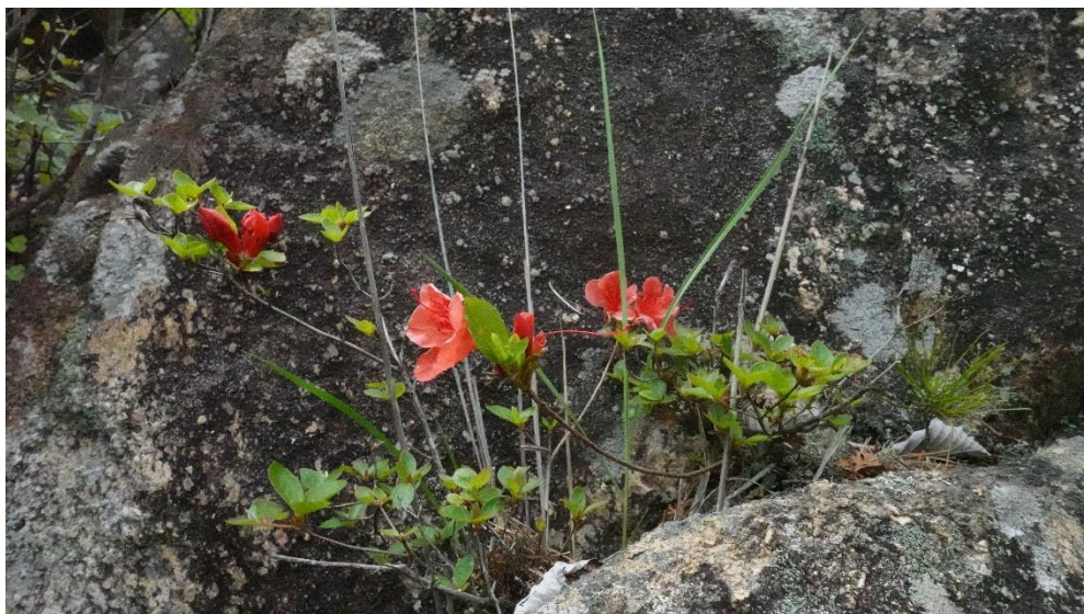
5/11 福王寺山の福王寺境内に咲いていたシャクナゲです。すぐ近くの金亀池では周囲に西洋シャクナゲが植栽されています。